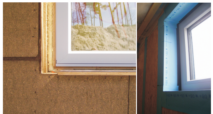
Vensterinbouw met goed zichtbaar multiplex kader, en het luchtdicht afkleven aan de binnenzijde. Arch.: Architecten Equilibrium-team, Foto: PHP vzw

Een andere oplossing bestaat erin om tussen raamkader en OSB-plaat een luchtdichte folie te verkleven. Deze oplossing is echter vaak arbeidsintensief en blijft gedurende de rest van de werf kwetsbaar. Een aantal raamfabrikanten bieden hiervoor een oplossing door hun ramen bij productie reeds te voorzien van een luchtdichte folie rondom het raamkader. Bij plaatsing moet deze dan enkel nog verkleefd worden aan de luchtdichte binnenlaag.